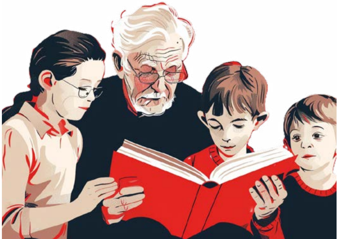
ILLUSTRATION VON MENSCHEN VERSCHIEDENER GENERATIONEN BEIM GEMEINSAMEN LESEN, MIT HILFE VON KI ERSTELLT VON SUSANN SCHULZ

Besonders problematisch ist, dass selbst wenn Hauptschüler mit Bildungslücken Praktika absolvieren, der Übergang zu weiterführenden Qualifikationen, wie Basis-kursen nicht immer gesichert ist.