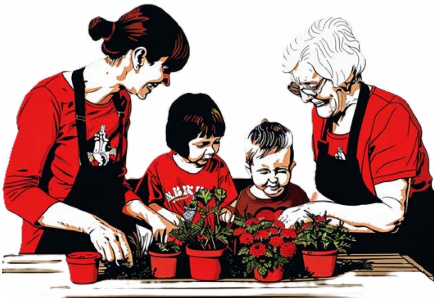
ILLUSTRATION VERSCHIEDENER GENERATIONEN BEIM BEPFLANZEN VON TÖPFEN, MIT UNTERSTÜTZUNG VON KI ERSTELLT, VON SUSANN SCHULZ

Im Repaircafé höre ich oft den Wunsch nach mehr Nachhaltigkeit und einem stärkeren Gemeinschaftsgefühl. Inspiriert durch diese Gespräche entstand die Vision eines grünen Treffpunkts in Wildau: Ein Gemeinschaftsgarten, der als Modell für ökologisches und soziales Miteinander dienen könnte.