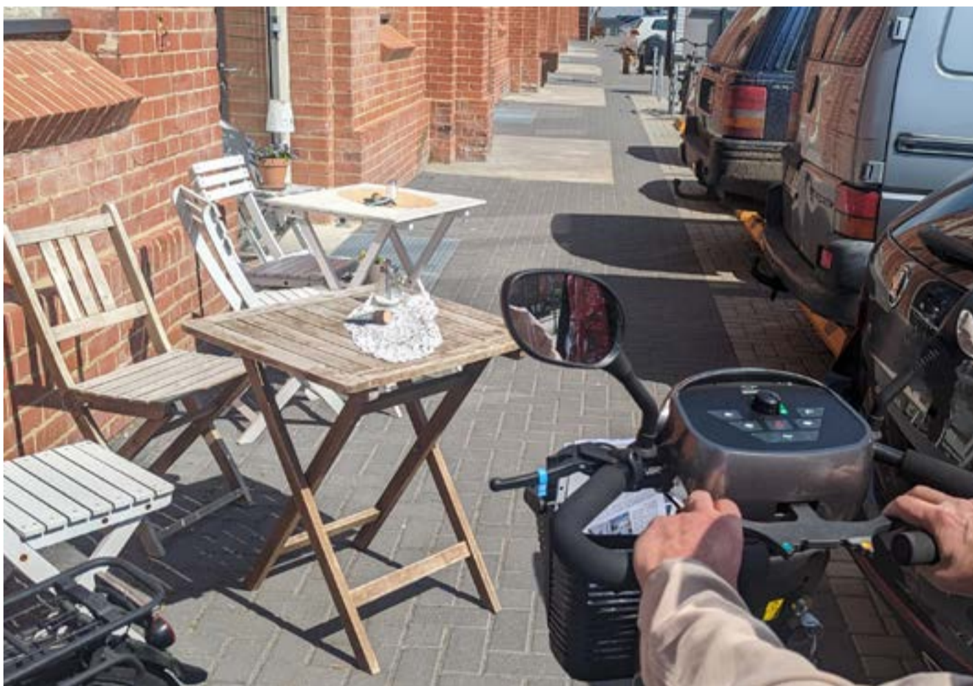
GEHWEG NEBEN LOK 21, AUFGENOMMEN AM 5. MAI 2023, FOTO: SUSANN SCHULZ

Wir untersuchten öffentliche Zugänge, Wege und Einrichtungen und erfuhren aus erster Hand, welche Hindernisse den Alltag erschweren können. Diese direkte Erfahrung war sowohl aufschlussreich als auch motivierend. Wir identifizierten viele Barrieren, wie hohe Bordsteinkanten und schwer zugängliche Eingänge. Besonders auffällig war die Situation an der Hinterlandstraße und am Marktplatz, wo Joachim, fast blind, auf die Gefahren im Dunkeln hinwies.