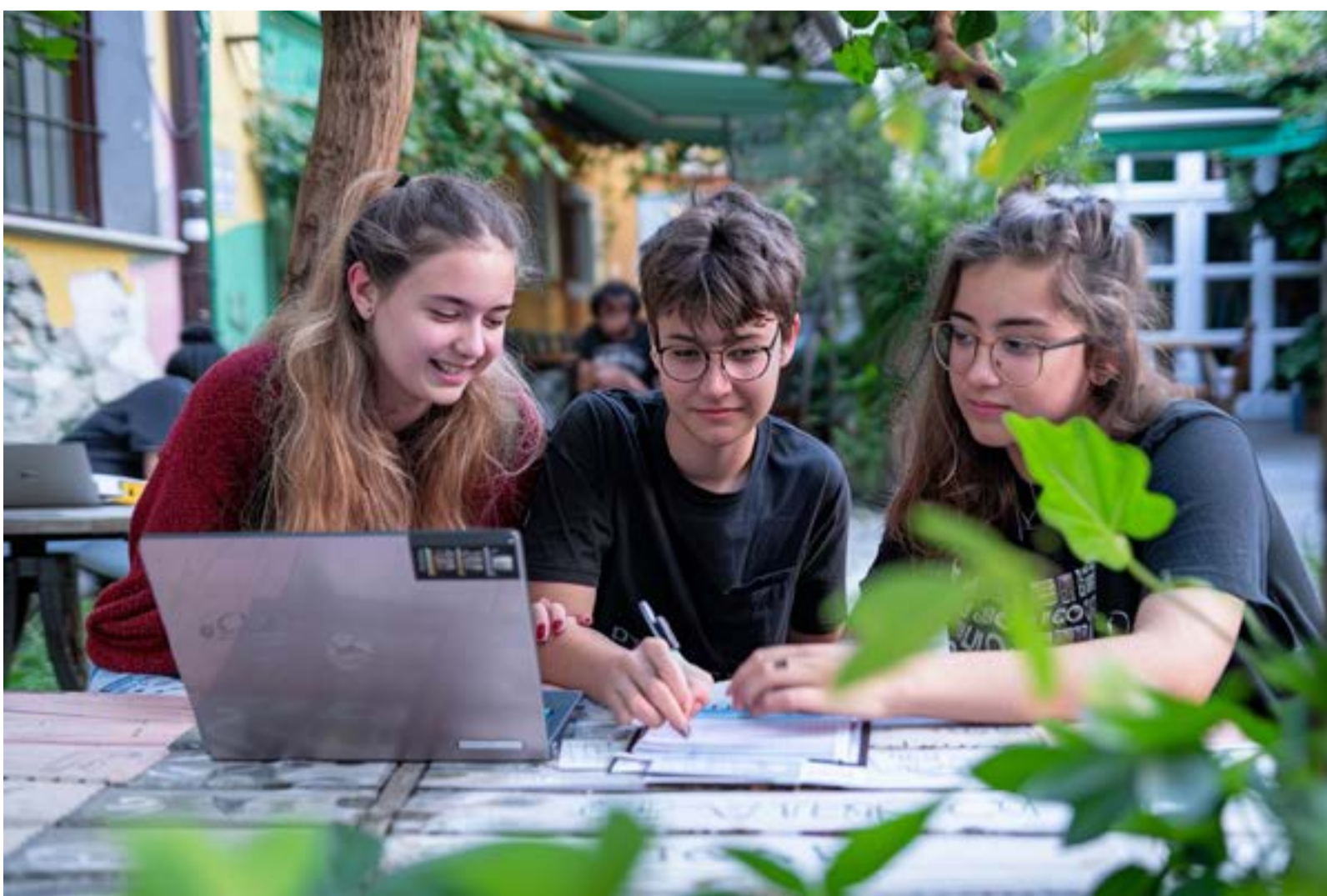
BILD MIT JUGENDLICHEN, DIE ZUSAMMENARBEITEN, MIT UNTERSTÜTZUNG VON KI ERSTELLT VON SUSANN SCHULZ

Diese Konzeption verdeutlicht nun klar, welche Punkte den jungen Menschen in Wildau wichtig sind und legt fest, wie und wann sie in Entscheidungsprozesse einbezogen werden sollen.