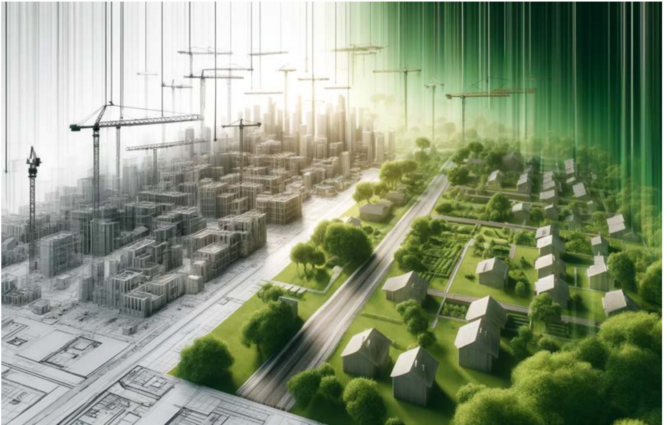
DIGITALE COLLAGE: DIE ZUNAHME URBANER BEBAUUNG AUF KOSTEN DER GRÜNFLÄCHEN, MIT HILFE VON KI ERSTELLT VON SUSANN SCHULZ

Seit 2014 bin ich Mitglied der Stadtverordnetenversammlung. Von Anfang an war ich Zeuge und zunehmend auch Akteur, wenn es darum ging, die Entwicklung Wildaus zu begleiten und zu beeinflussen. Viele Einzelprojekte wurden diskutiert, die - jedes für sich - durchaus ihren Reiz hatten.